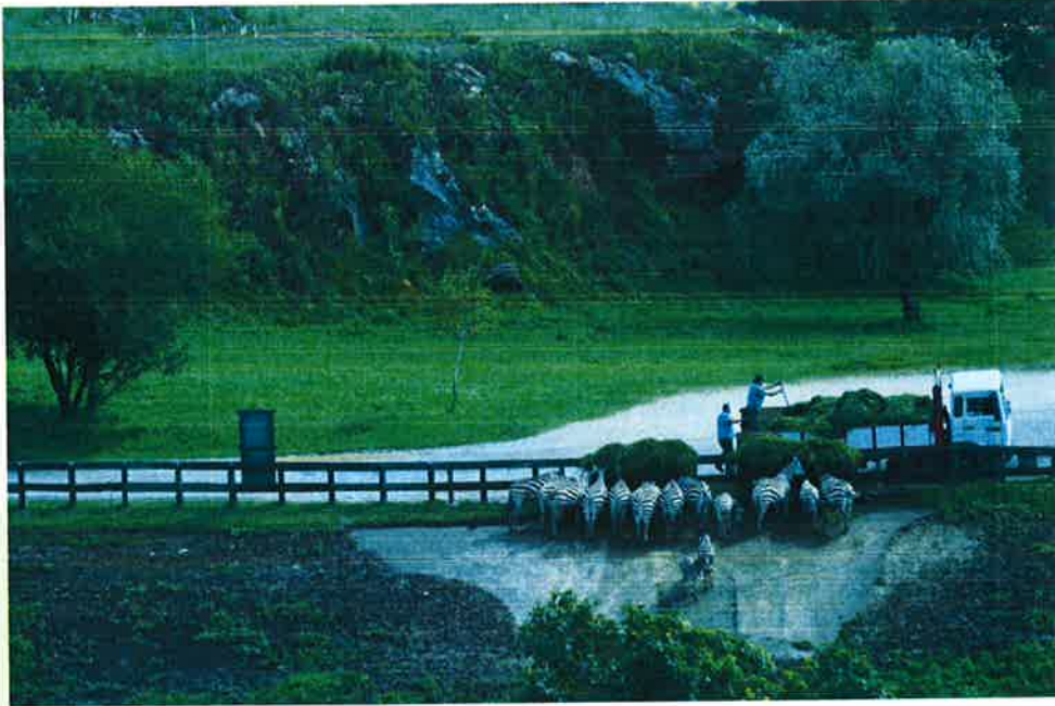
Foto N°2.- Manada de Cebras alimentándose de hierba en verde suministrada por el personal del Parque.

Además, en función de las necesidades de cada animal, se añade como complemento en su dieta diaria un porcentaje de pienso y de hierba seca, para favorecer el aporte proteico y de grasa. De igual forma, en las épocas que escasea la hierba en verde o que las inclemencias meteorológicas no permiten realizar la siega en el Parque, se les administra hierba seca de manera única y en mayor cantidad en su alimentación diaria.