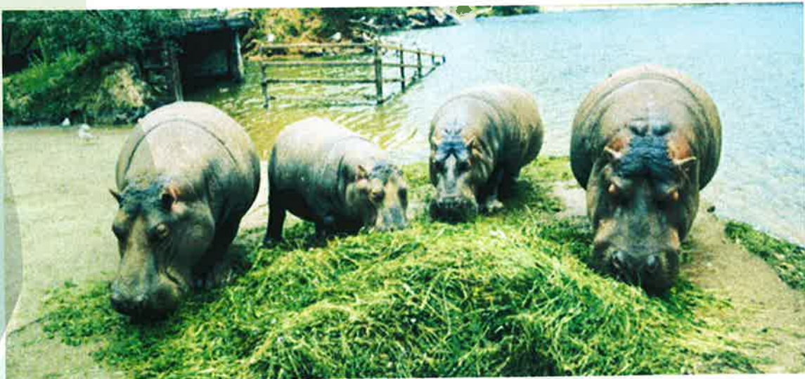
Foto Nº1.- Grupo de Hipopótamos alimentándose de Hierba en verde suministrada por el personal del Parque.

Esta alimentación mediante pasto en el recinto, no es suficiente para completar las necesidades básicas de cada animal, por lo cual se les da un aporte diario suplementario de hierba en verde en el interior de las zonas de recogida y descanso, que procede de la siega diaria de las praderas y áreas verdes del Parque de la Naturaleza, que se realiza por parte del personal de la sección de animales.