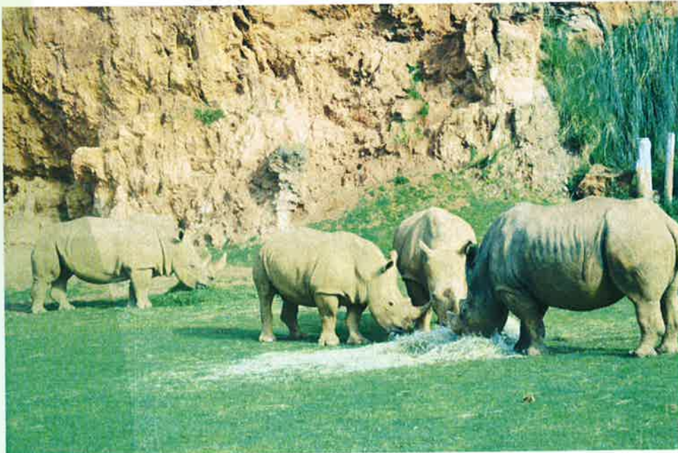
Foto N°3.- Grupo de Rinocerontes alimentándose de hierba en verde y seca respectivamente.

CANTUR, S.A. (Sociedad Unipersonal) Reg. Mercantil Cantabria, Tomo 534, Folio 48, Sección 8, Hoja S-5060 • N.I.F. A-39008073