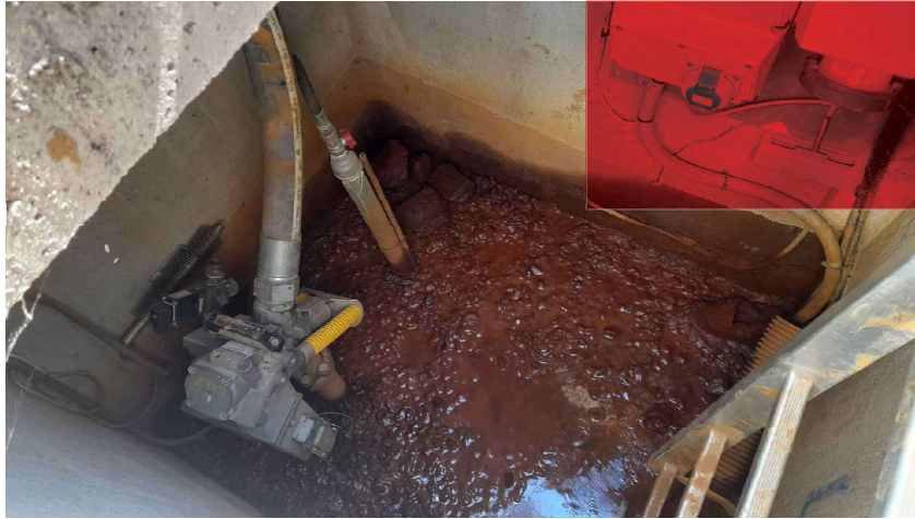
UBICACIÓN DE LA APARAMENTA ECLÉCTICA DE MANDO DEL CAÑÓN DE INNIVACIÓN