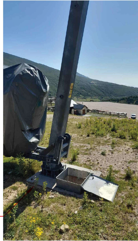
DETALLE DE LA ARQUETA Y PROPUESTA DE ORIENTACIÓN PARA LA ENTRADA DE LAS CANALIZACIONES