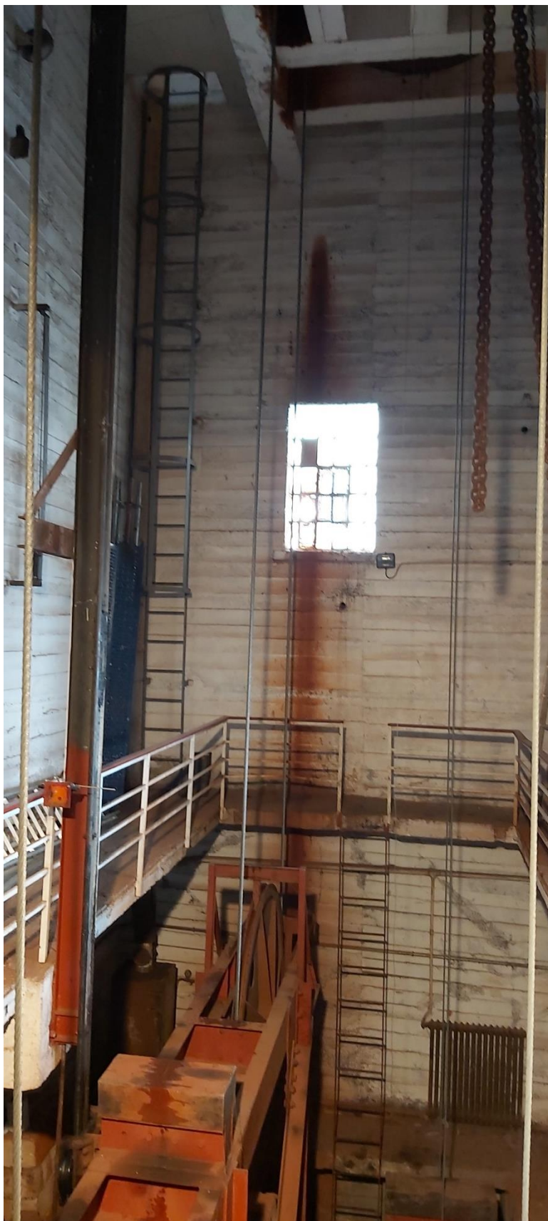
PASO Y PASARELA ESTACIÓN SUPERIOR DE FUENTE DÉ