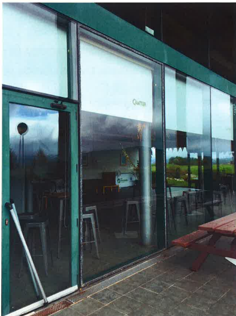
Fotografía N°2. Vidrio roto al lado de puerta exterior (Fachada Sur)

También se informa de la necesidad de sustituir la puerta exterior, situada en la fachada Oeste, que da acceso a zonas de personal y almacenes en la Planta Baja.