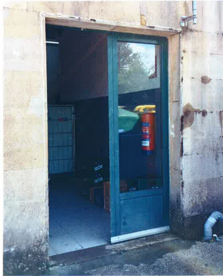
Fotografía Nº3. Puerta exterior a sustituir (Fachada Oeste)