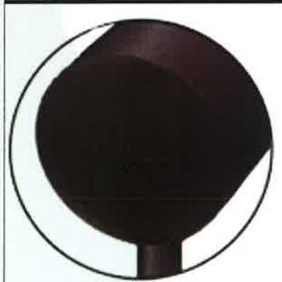
Barandilla tubular recta 6m 6m de largo x 0,60m alto (diámetro tubo 30cm)