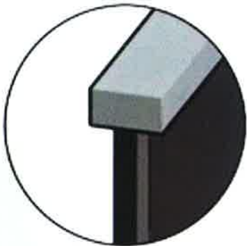
Barandilla rectangular subida + bajada 3m+3m (cuadradillo) 6m largo x 0,60m alto x 0,80m ancho