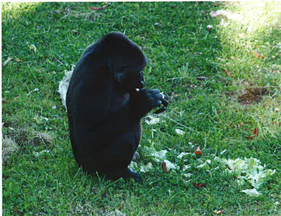
Foto Nº1.- Gorila alimentándose de frutas, verduras y hortalizas suministrada por el personal del Parque.

Actualmente, el Parque de la Naturaleza de Cabárceno cuenta con 17 especies de animales, como son: Elefantes, Gorilas, Osos, Hipopótamos Anfibios, Hipopótamos Pígmicos, Rinocerontes, Monos de Gibraltar, Monos Brazza, Papiones, Jirafas, Puercoespines, Perritos de las Praderas, Suricatas, Mangostas, Jabalíes, Tortugas e Iguanas.